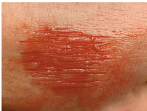
Schürfwunde U 1