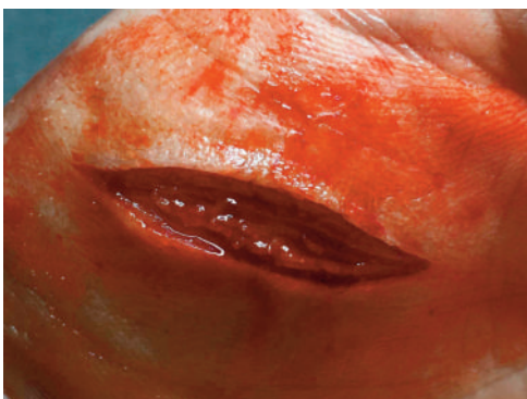
Stichwunde Y 3